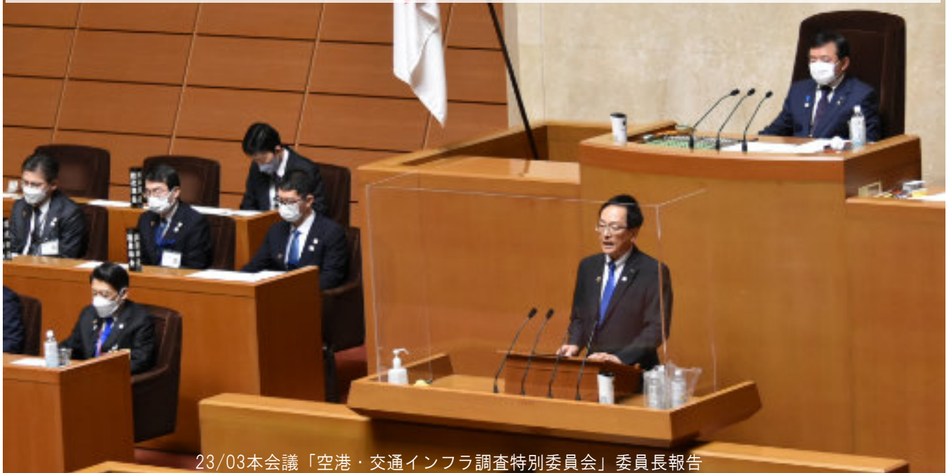
23/03本会議「空港・交通インフラ調査特別委員会」委員長報告